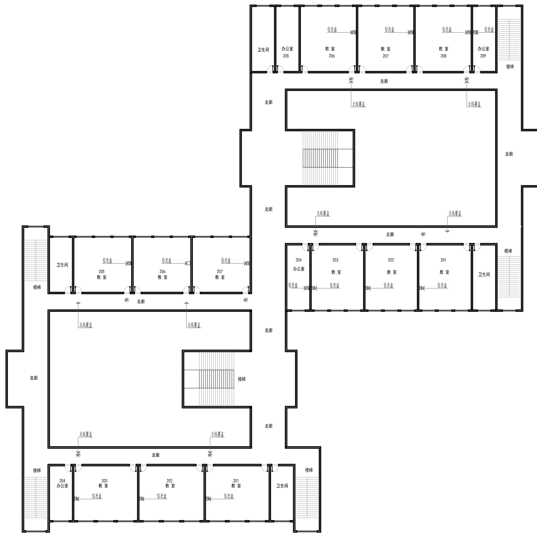
LAYOUT PLAN 一层-四层网络改造点位图 SCALE 1:200